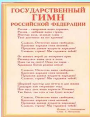
Государственный гимн РФ